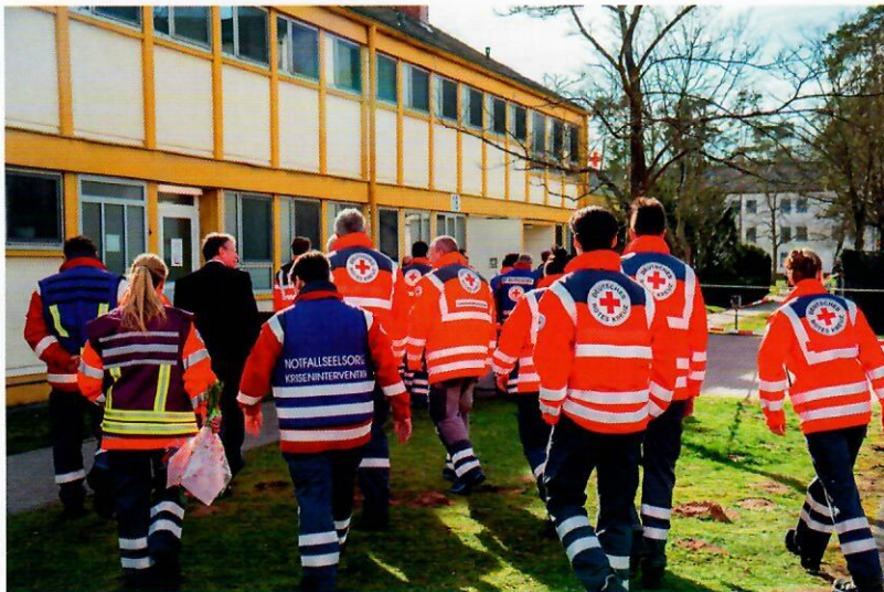
Abb. 2: Die Einsatzkräfte arbeiten derzeit unter hohem Druck und haben ein enormes Arbeitspensum zu erfüllen, während sie selbst einem erhöhten Infektionsrisiko ausgesetzt sind.