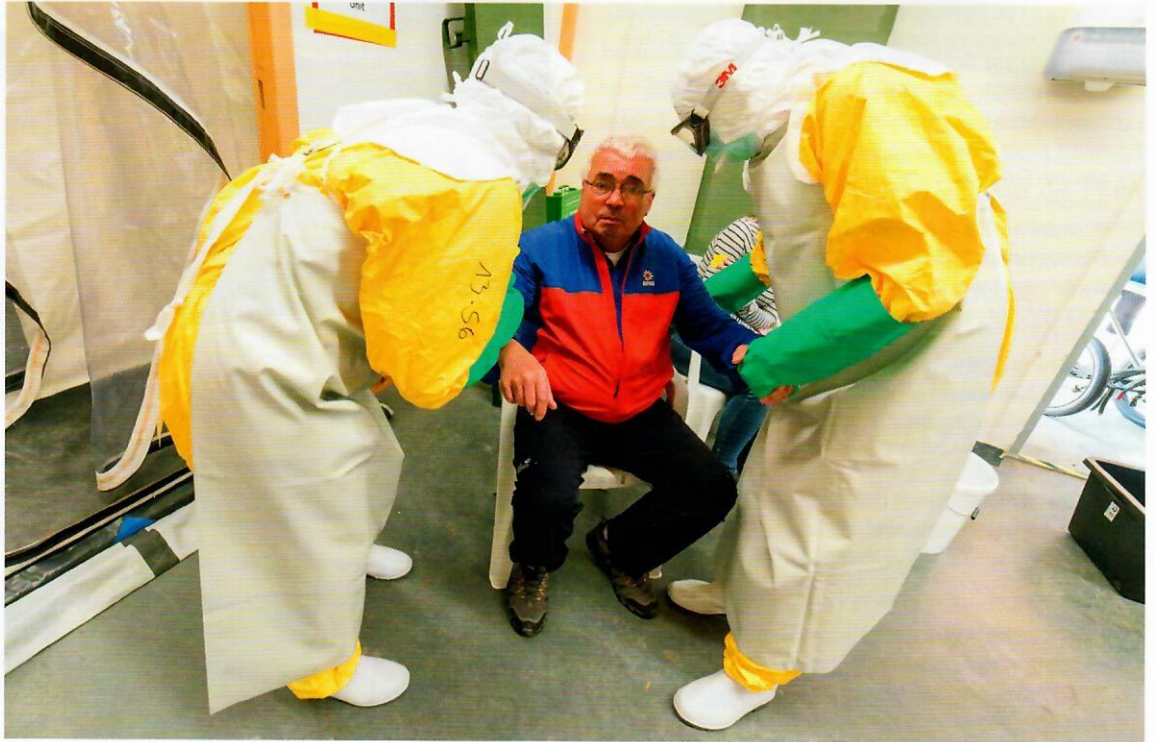
Abb. 1: Die derzeitige Situation ist für die gesamte Bevölkerung außergewöhnlich: Ein „unsichtbarer Feind“ löst bei den meisten Menschen eine besonders starke Beunruhigung und Bedrohungsgefühle aus.